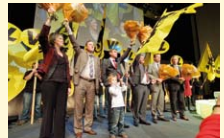
Het Vlaams Belang is de enige partij met een strategie om Vlaanderen uit het Belgische slop te halen.