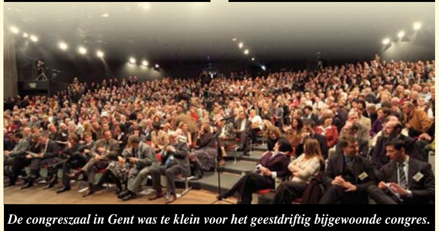
De congreszaal in Gent was te klein voor het geestdriftig bijgewoonde congres.